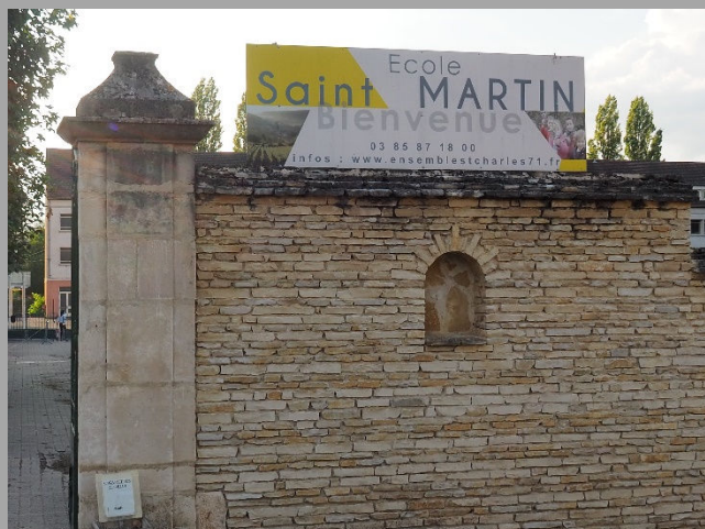
DES BATIMENTS ANCIENS SITUÉS AU CŒUR DE LA VILLE