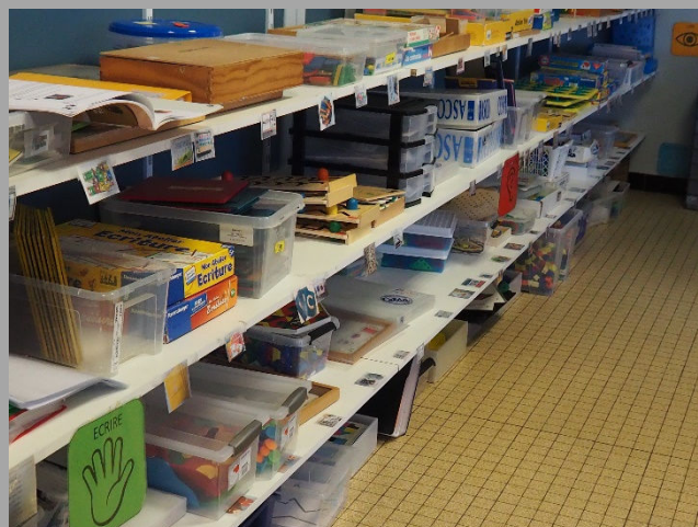
DU MATERIEL VARIE MIS EN VALEUR PAR UNE EQUIPE DYNAMIQUE