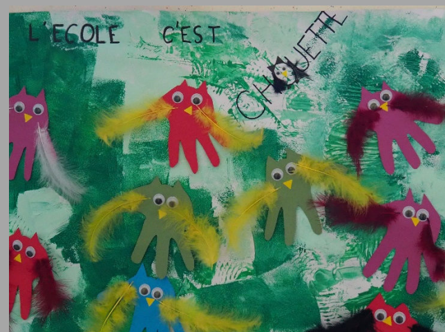
UNE ECOLE A L'ESPRIT OUVERT QUI VEUT QUE LES ELEVES SOIENT HEUREUX